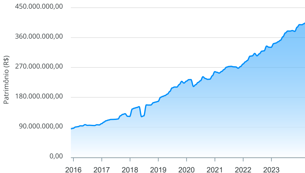
Evolução do Patrimônio